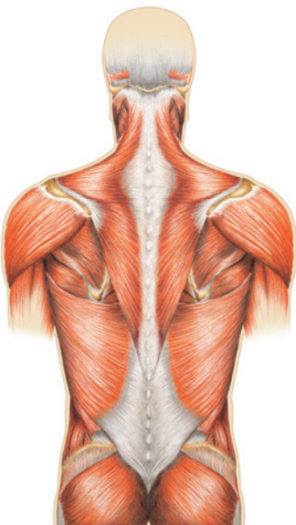
Die Rückenmuskulatur: sorgt für Bewegung, aufrechte Haltung, Unterstützung der Wirbelsäulenstabilität.

Die menschliche Wirbelsäule besteht aus 24 Wirbeln. Zwischen den einzelnen Wirbeln liegen die Bandscheiben und dämpfen Erschütterungen. Im Wirbelkanal, der von den knöchernen Bögen der Wirbel gebildet wird, befindet sich das Rückenmark, aus dem viele Nervenbündel austreten. Bänder entlang der Wirbelsäule sorgen für Stabilität. Eine kräftige Rückenmuskulatur ermöglicht Bewegungen, eine aufrechte Haltung und unterstützt die Stabilität der Wirbelsäule.