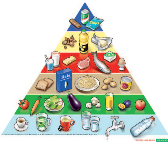
Schweizer Lebensmittelpyramide – Empfehlungen zum ausgewogenen und genussvollen Essen und Trinken für Erwachsene

Früchte enthalten von Natur aus Frucht- und Traubenzucker. Mit Mass konsumiert, haben sie in einer ausgewogenen Ernährung bei Diabetes einen wichtigen Platz. Früchte liefern uns wichtige Vitamine (z.B. Vitamin C), Mineralstoffe, sekundäre Pflanzenstoffe und nicht zuletzt auch Nahrungsfasern.